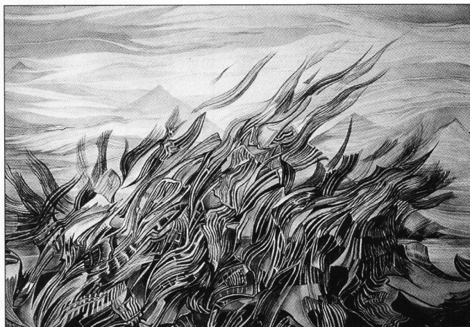
Une œuvre de Jeannine Fortin.